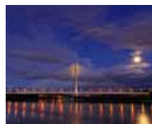
River Suir Brücke (IR)