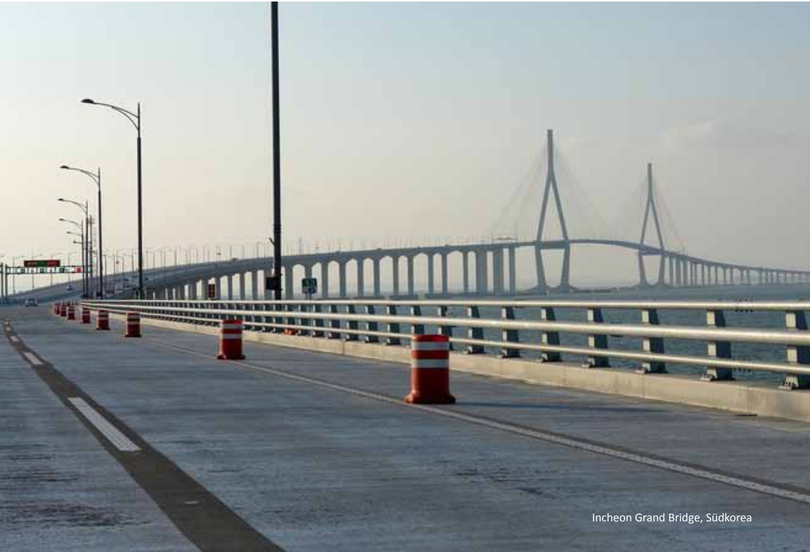
Incheon Grand Bridge, Südkorea