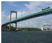
Alvsborg Brücke (SE)