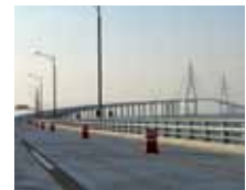
Incheon Grand Brücke (KR)