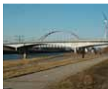
Dintelhaven Brücke (NL)