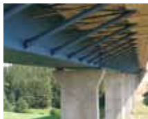
Steinbachtal Brücke (DE)