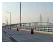
Incheon Grand Brücke (KR)