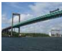
Alvsborg Brücke (SE)