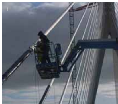
1 Sensorinstallation an einer Schrägseilbrücke 2 Optionales Solarpanel zur Stromversorgung