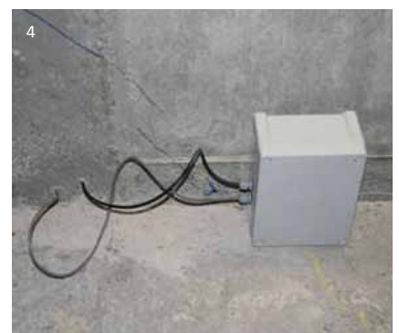
1 Fernüberwachung mit Webcam