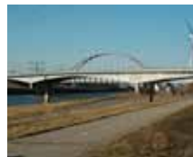
Dintelhaven Brücke (NL)