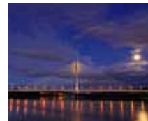
River Suir Brücke (IR)