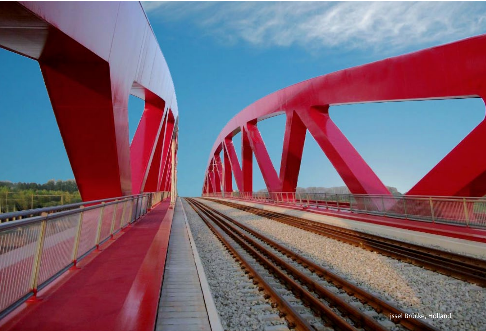
IJssel Brücke, Holland