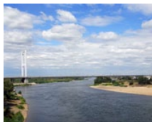
Irtysch River Brücke (KZ)