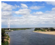
Irtys River Brücke (KZ)