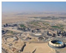
Dubai Sports Complex (AE)