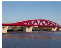
Ijssel Brücke (NL)