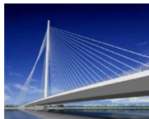
Da Nang Bridge (VN)