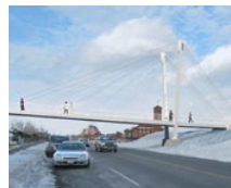
Revere Bridge (US)