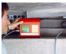
Hub- und Messlager