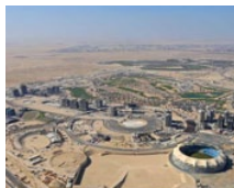
Dubai Sports Complex (AE)