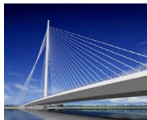
Da Nang Bridge (VN)