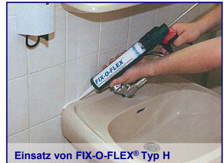
Einsatz von FIX-O-FLEX® Typ H

FIX-O-FLEX® ist eine Gruppe von Klebstoffen und Dichtmassen, deren Materialbasis ein silanmodifiziertes Polymer ist, die durch Feuchtigkeit zu einem elastischen Produkt aushärtet. Dieses sogenannte SMP-Polymer hat einige Vorteile gegenüber Kleb- und Dichtstoffen auf Acrylat-, Polyurethan- oder Silikonbasis wie z. B. hohe chemische Beständigkeit, sehr geringes Schrumpfverhalten, breites Haftungsspektrum, hohe Temperaturstabilität und ausgezeichnete Witterungs- und Alterungsbeständigkeit. Aufgrund der besonderen Rezeptur sind alle FIX-O-FLEX®-Typen in der Lage, auf mattsfeuchten Untergründen eine ausgezeichnete Haftung auszubilden. Abhängig von der Viskosität und der Verarbeitungstechnik können einige Typen sogar unter Wasser appliziert werden.