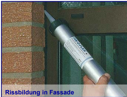
Rissbildung in Fassade