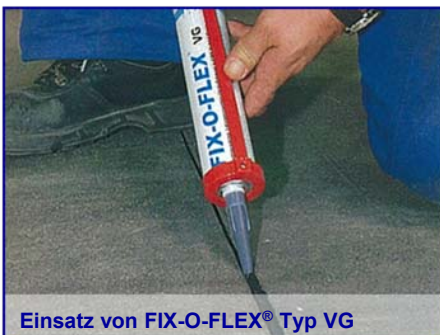
Einsatz von FIX-O-FLEX® Typ VG

Je nach Typ ist FIX-O-FLEX® als Dichtstoff in mechanisch besonders stark belasteten Fugen, z.B. Industrieanlagen, Fahrbahnen usw. einsetzbar. Aufgrund seiner hohen Chemikalienbeständigkeit ist FIX-O-FLEX® besonders für chemisch belastete Bereiche geeignet (siehe Beständigkeitsliste). FIX-O-FLEX® ist selbst in frischem Zustand äusserst haftstark, so dass bereits nach dem Zusammenfügen der zu verklebenden Teile eine hohe Haltekraft erreicht wird. Das Produkt kann auch für die Verklebung von TENZA®-Quellgummiprofilen verwendet werden.