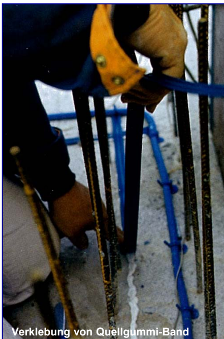
Verklebung von Quellgummi-Band