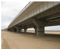
Awaza Brücke (TM)