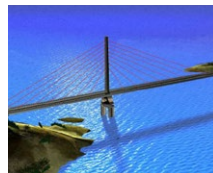
Agin Brücke (TR)