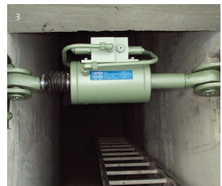
1 Leistungsdiagramm 2 Abdichtungssystem 3 Installierter RESTON®STU