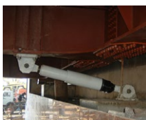
RESTON®SA & STU