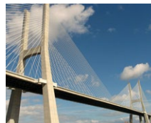
Vasco da Gama Brücke (PT)