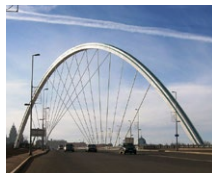
Ramstore Brücke (KZ)