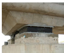
LASTO®LRB & HDR