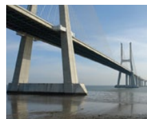
Vasco da Gama Brücke (PT)