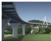
Pont de la Poya (CH)