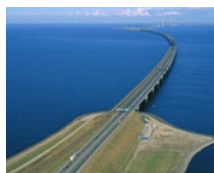
Storebaelt West Brücke (DK)