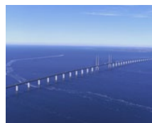
Øresund Brücke (DK/SE)