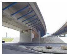
Pont sur le Buron (CH)