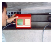
Hub- und Messlager